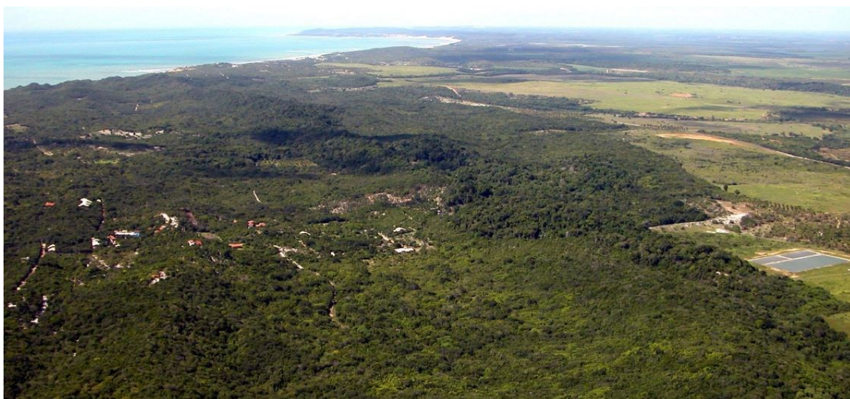
Parque Estadual Mata da Pipa, vista aérea

1ª ETAPA – 26 de fevereiro de 2023 Parque Estadual Mata da Pipa (PEMP) MUNICÍPIO DE TIBAU DO SUL